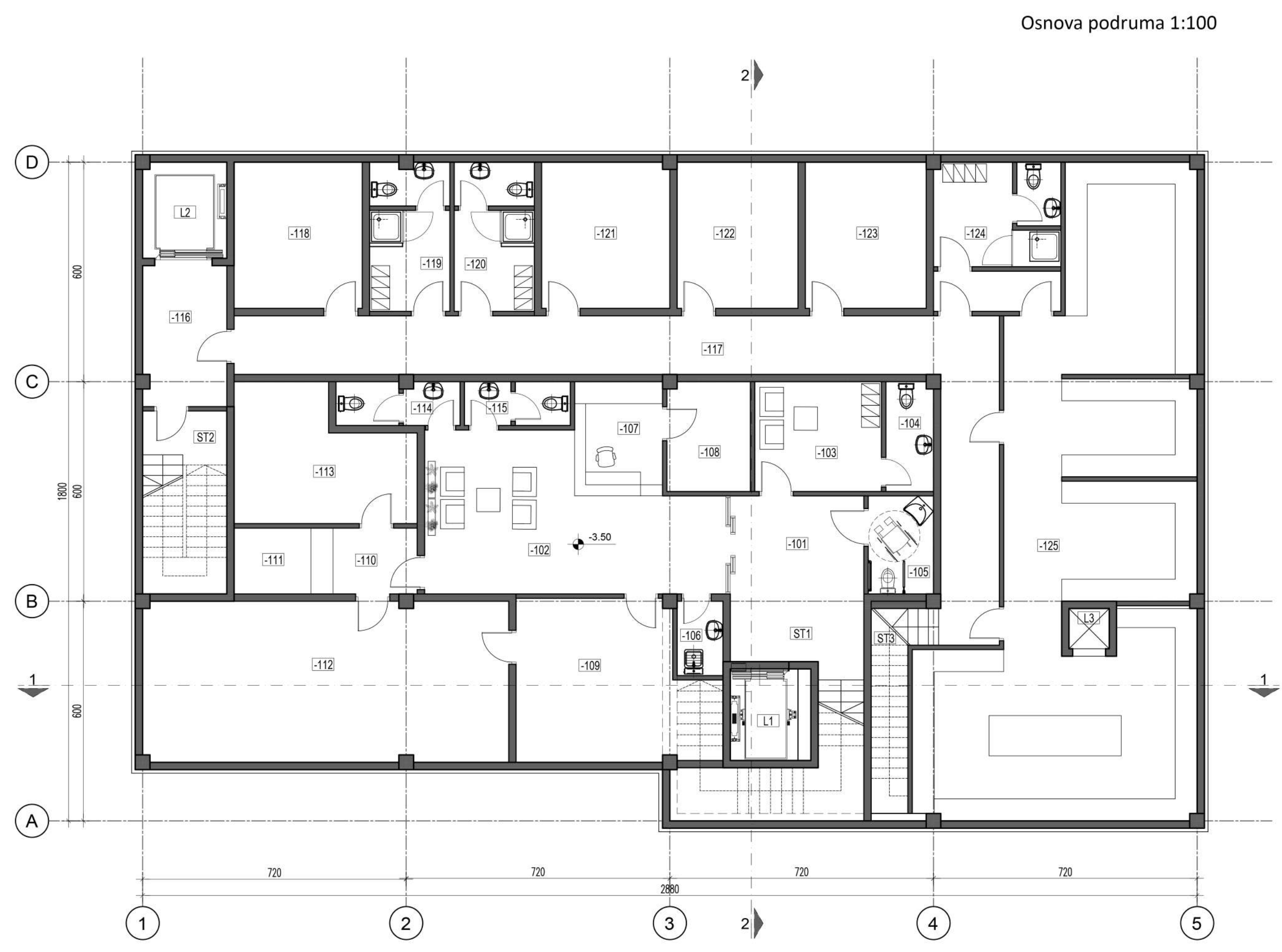
Osnova podruma 1:100