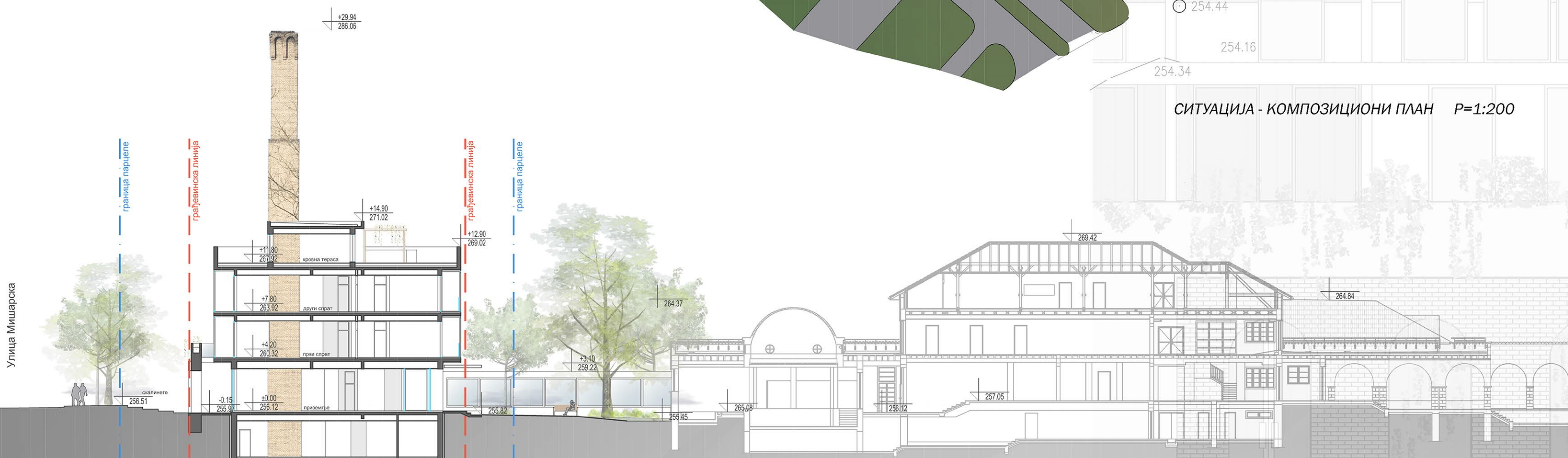
ПРЕСЕК КРОЗ ТЕРЕН P=1:200